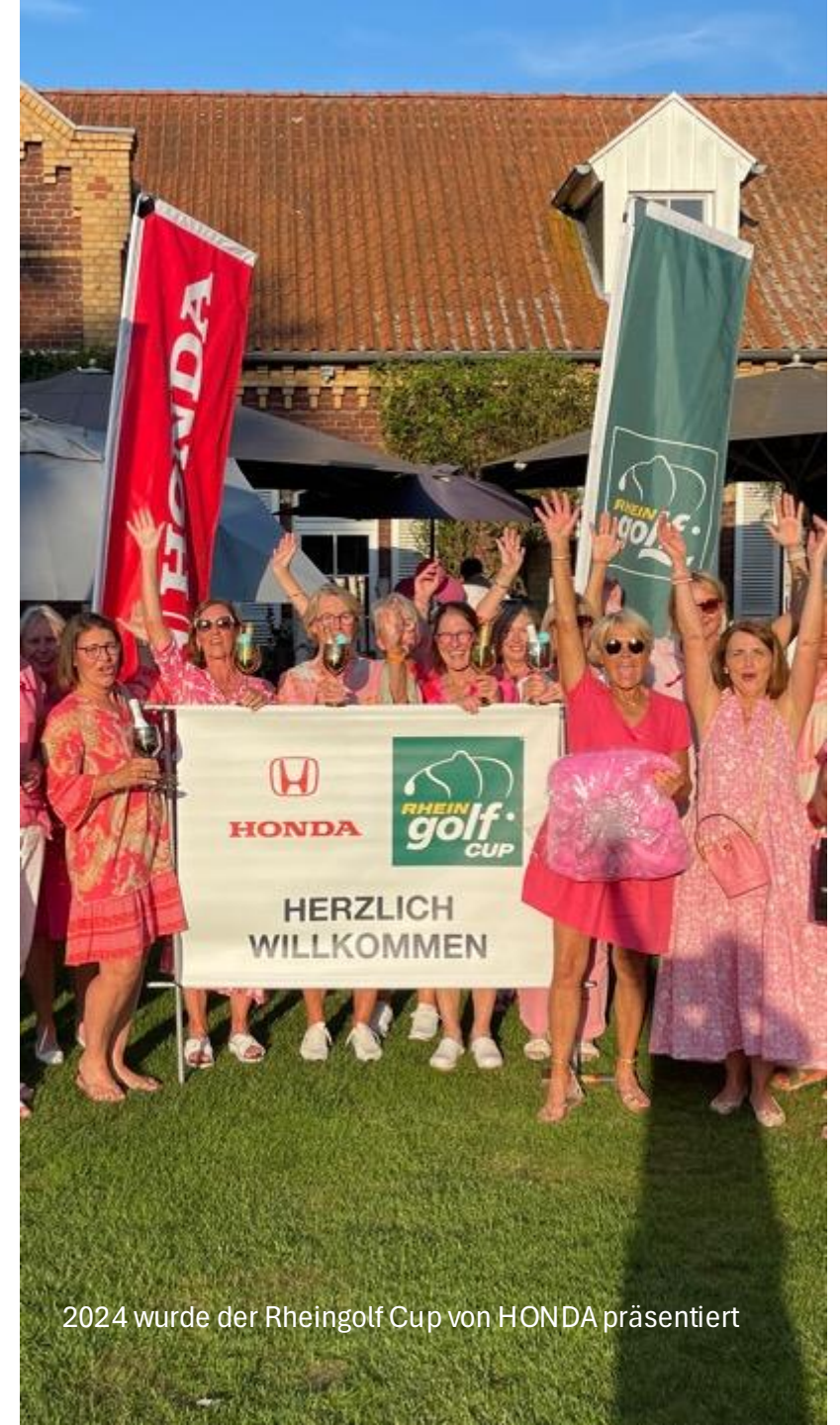
2024 wurde der Rheingolf Cup von HONDA präsentiert